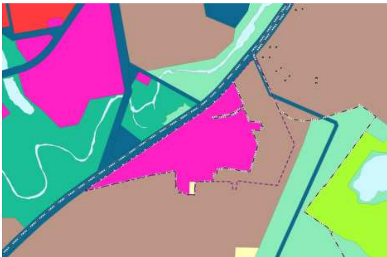
Схема границ территории, в отношении которой утверждается документация по планировке территории в составе проекта планировки и проекта межевания территории элемента планировочной структуры 01:18 (мкр. Энергетик)