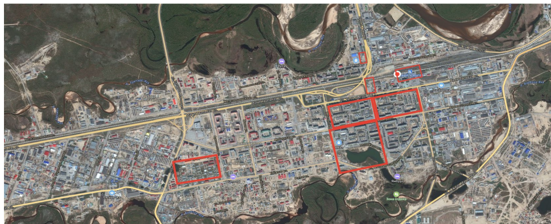
Схема размещения мест с высокой проходимостью на территории городского округа город Новый Уренгой Ямало-Ненецкого автономного округа

к постановлению Администрации города Новый Уренгой от 09.01.2025 № 1