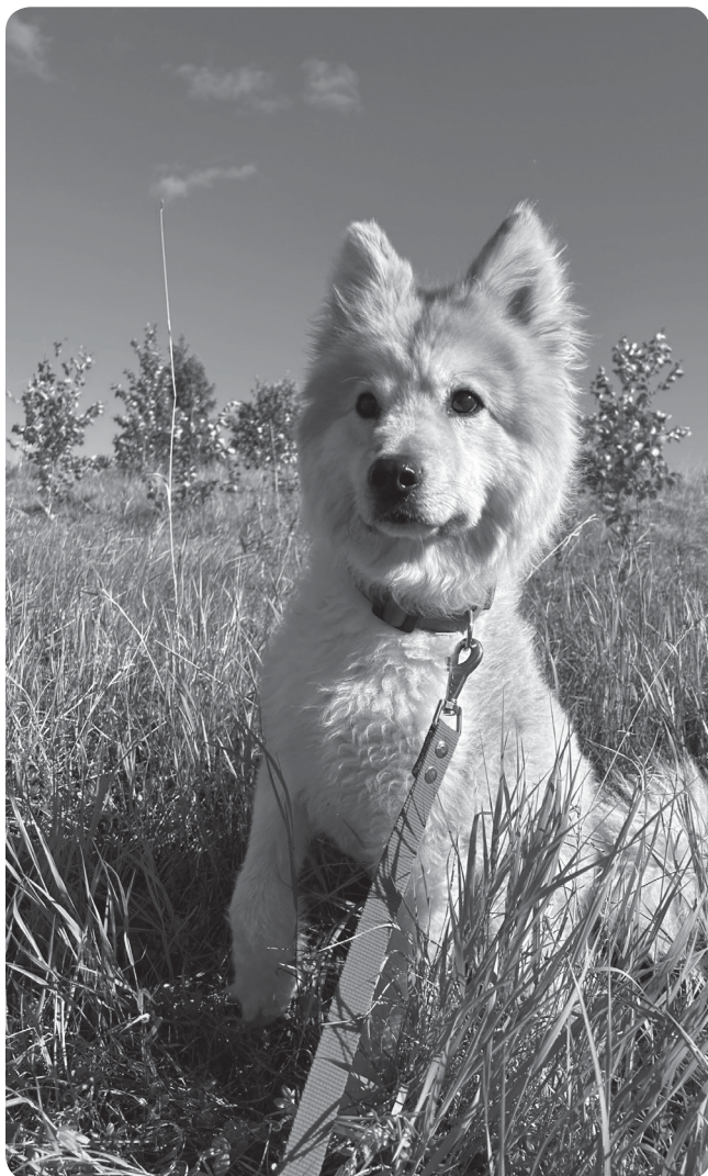
Дейзи ищет дом.

Поводок - отлично, туалет - строго на улице, в еде неприхотлива, с другими собаками уживается прекрасно, к кошкам интерес не проявляет.