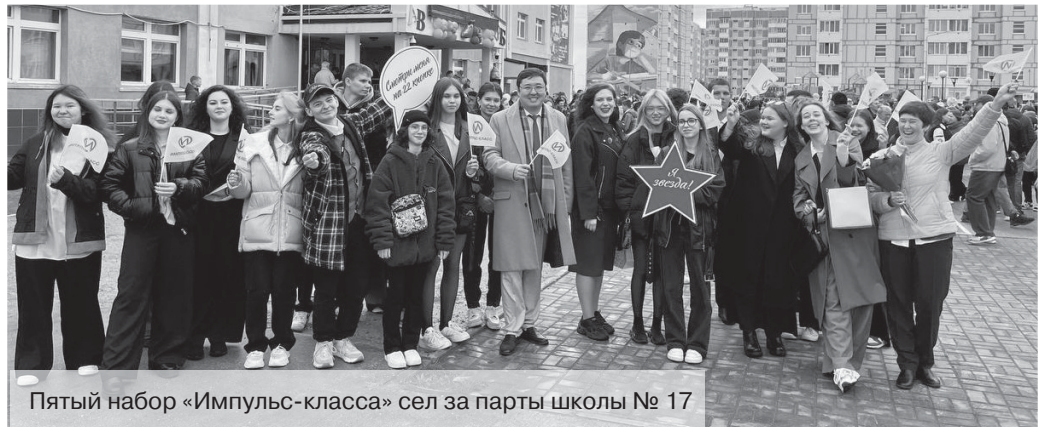
Пятый набор «Импульс-класса» сел за парты школы № 17