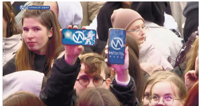
Зрители, которые оторвались в этот день от домашних дел и пришли на площадь, очень зримо поддерживали любимую телекомпанию.

Любимый праздник посетили тысячи новоуренгойцев. Они не только гуляли по центральной площади, но и участвовали в мастер-классах, соревнованиях и прочих активностях для детей и взрослых. Следующий день рождения Нового Уренгоя станет юбилейным - пятидесятым!