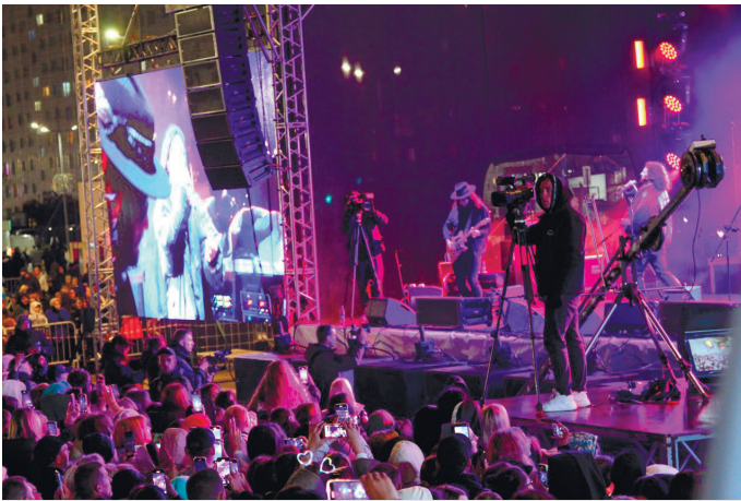
В финальном концерте на открытой сцене «Октября» выступили новоуренгойские и приглашённые артисты.