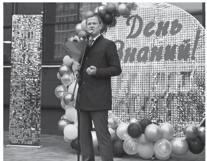
Антон Колодин, Глава города Новый Уренгой: - Успешного учебного года! У вас всё получится, мы всегда рядом!