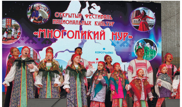
В воскресенье на городской площади прошёл фестиваль «Многоликий Нур» - 13 национальных подворий встречали гостей песнями, танцами, традиционными обрядами и блюдами национальных кухонь.