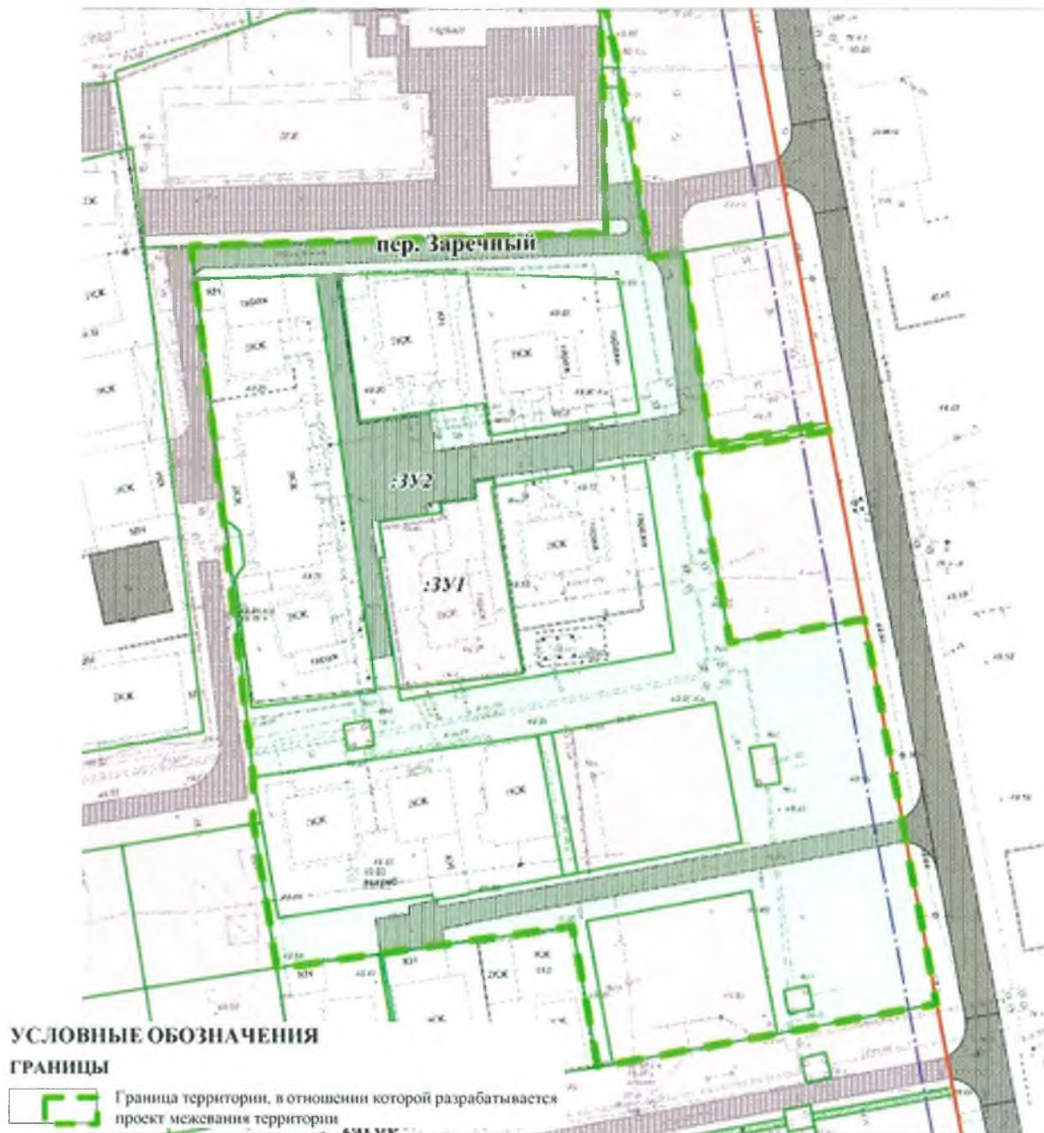
Схема границ территории, в отношении которой вносятся изменения в документацию по планировке территории планировочного квартала 01:12:02 (проект межевания территории)

к постановлению Администрации города Новый Уренгой от 08.05.2024 № 246